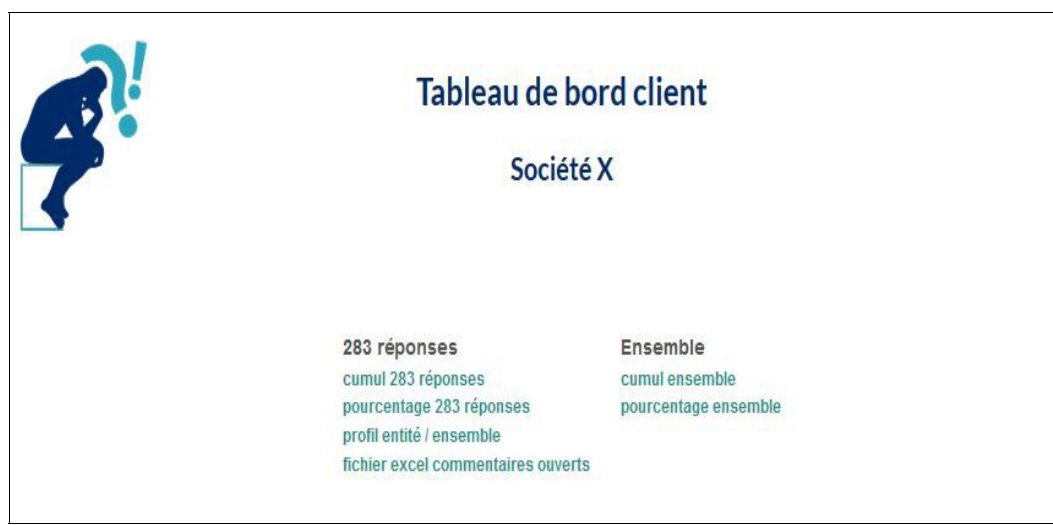
Tableau de bord : suivi en temps réel

Au fur et à mesure que les participants répondent, votre tableau de bord vous permet de suivre en temps réel le déroulement de l'enquête. Les résultats sont disponibles sous différentes formes de rapports et graphiques.